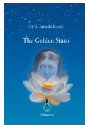
K. Parvathi Kumar: The Golden Stairs. Copias: The World Teacher Trust España.