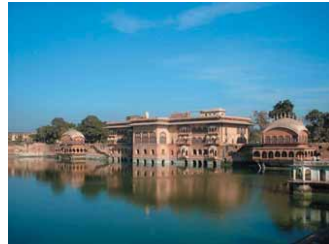
El palacio de Deeg (Digh)

parecía estar bastante feliz. Sin sombrero e inquieto en el asiento delantero del carruaje donde ya se había subido, se zambulló por las olas del aire abrasador como un nadador se habría sumergido a través de las frías olas de un río, asegurándonos de que no hacía tanto calor después de todo, y de que en Bengal, un día tal, hubiera sido considerado por mucha gente, un día fresco.