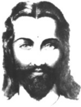
Maitreya El Señor