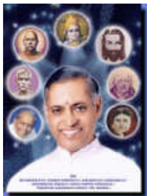
CARTA Nro. 12 CICLO 19