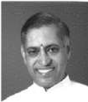
CARTA Nro. 6 CICLO 19

* Traducción al español por Hnos. del World Teacher Trust