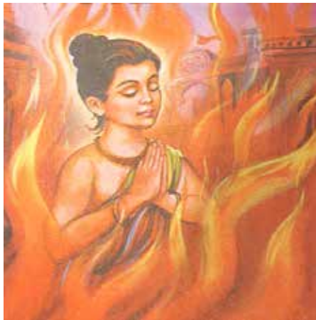
Prahlada dans le Feu

Alors, Prahlada dit : « Ce que vous dites est vrai. Mon clan est un grand clan qui mérite des éloges. Tous les descendants de Mahirshi considèrent que notre clan est important. Il est également vrai que mon père a réalisé des actes qui excellent tous dans cette création. Tout cela peut être compris. Je sais que c'est vrai. Je vous assure que tout cela n'est pas faux. Mon père est le plus grand précepteur de tous nos précepteurs. Il n'y a même pas la moindre illusion dans ce que vous dites. J'obéis également à la loi que notre propre père est notre précepteur et doit être vénéré. Je n'ai jamais transgressé la loi. Je suis tout à fait déterminé à ce propos. Quelle est votre conclusion ? Disant cela, il resta silencieux et conserva le respect des aïeux.