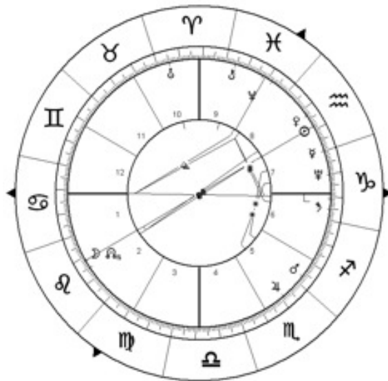
Pleine Lune du Verseau, 31 janvier 2018, 14.26.

LE BONHEUR EST DANS LE FAIT DE DONNER ET NON DE PRENDRE. LE SOLEIL DONNE LA VIE. IL EST HOMME. LA LUNE REÇOIT. ELLE EST FEMME. LA LUNE A DES PHASES DE CROISSANCE ET DE DÉCROISSANCE.