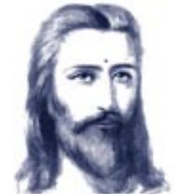
Maître Koot Hoomi - Devapi Maharshi -

Le subtil se déplace naturellement vers le haut tandis que le dense se déplace vers le bas. Si vous analysez vos pensées quotidiennes, elles rodent principalement autour du monde objectif terrestre. Votre mental est en général encombré de pensées terrestres. En accentuant autre chose, vous entrerez dans le supra-terrestre. Alors vous trouverez une libération immédiate du conditionnement terrestre. Faites en une habitude de contacter le subtil. Nous sommes disponibles pour vous dans le royaume supra terrestre et pas tellement dans le royaume terrestre. Nous vous aidons si vous reliez au supra terrestre. Vous allez être renforcés pour gérer votre vie terrestre et en acquérir la maîtrise. Le Royaume de Dieu est dans le subtil, le supra terrestre. Le royaume terrestre le cache. Dépassez le voile par votre pratique régulière.