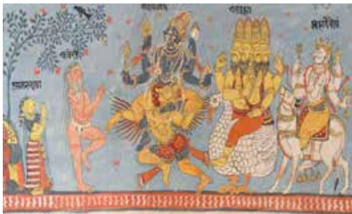
Athri, Anasuya et la Trinité

Athreya signifie, en Sanscrit, « le fils d'Athri ». Athri est l'un des sept sages/principes de la Création. Athri signifie également en Sanscrit, « pas trois ». Celui qui descendit de ce qui n'est pas trois est appelé «Athreya».