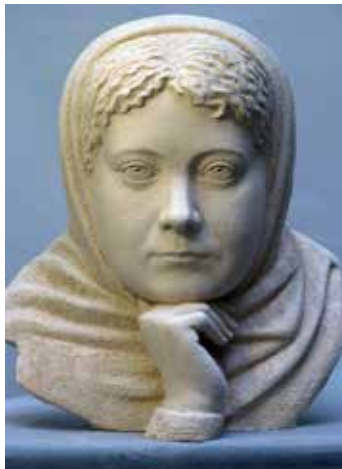
Alexey Leonov: H.P. Blavatsky

L'homme peut recevoir de nombreuses impressions dans sa conscience et les enregistrer dans sa mémoire. Lorsque la mémoire est entraînée à répondre à la conscience de soi, l'intensité de cette capacité de réponse résulte en souvenirs, permettant aux impressions d'être emporté au-delà d'une vie.