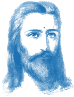
Maître Koot Houmi - Devâpi Maharshi -