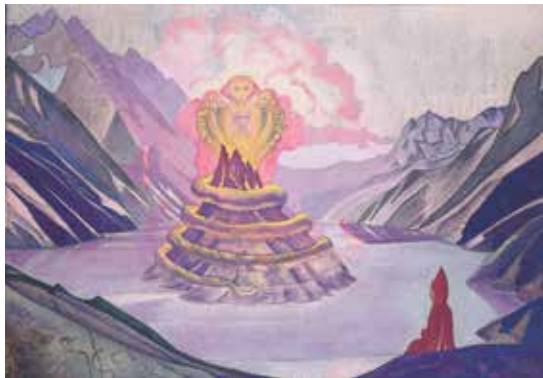
Nagajurna Nicholas Roerich

L'attitude de réaliser des miracles est uniquement pour montrer une supériorité humaine dans la société. Toute religion qui est occupée avec la propagande est victime d'une telle mise en valeur d'elle-même. L'attitude de l'église chrétienne est considérée par les Lamas tibétains et tartares comme puérile. Seuls les enfants essaient de faire du 'show', tandis qu'un adulte mature va contenir et réaliser.