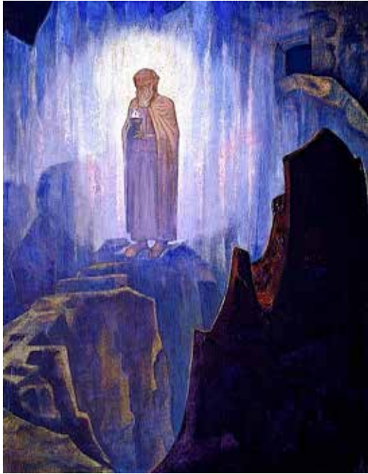
L'Enseignant Nicholas Roerich

stiné à atteindre la Vérité. Les Enseignants sont les aides de la Nature, pour aider les chercheurs. Bénis sont ceux qui réalisent cet arrangement naturel. Généralement, l'orgueil de l'homme ne lui permet pas de suivre l'Enseignant. Fréquemment, son intellect et sa logique sont les obstacles pour qu'il suive, et son orgueil l'aveugle et l'empêche de voir l'Enseignant.