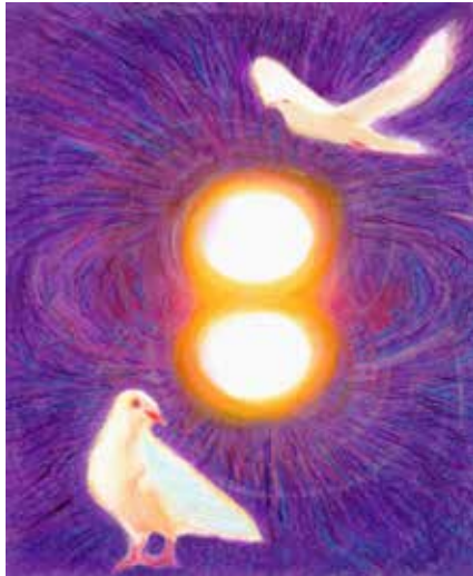
Image du Mois de la Balance La Balance - L'Oiseau Supérieur et Inférieur et le Magnétisme de la Vie

Il est dit qu'il y a deux oiseaux sur le tronc vertical de l'arbre de vie. Ils sont identiques et coexistent. L'un d'entre eux se réjouit de manger les fruits de l'arbre. L'autre se réjouit en voyant le premier oiseau se réjouir de manger. Il est plaisant de noter que les personnes nées sous l'influence de la Balance sont charitables et se réjouissent à la vue du bonheur des autres. L'oiseau d'en haut existe dans l'immortalité, tandis que l'oiseau d'en bas mange l'immortalité et se réjouit du goût comme étant le fragment de son expérience.