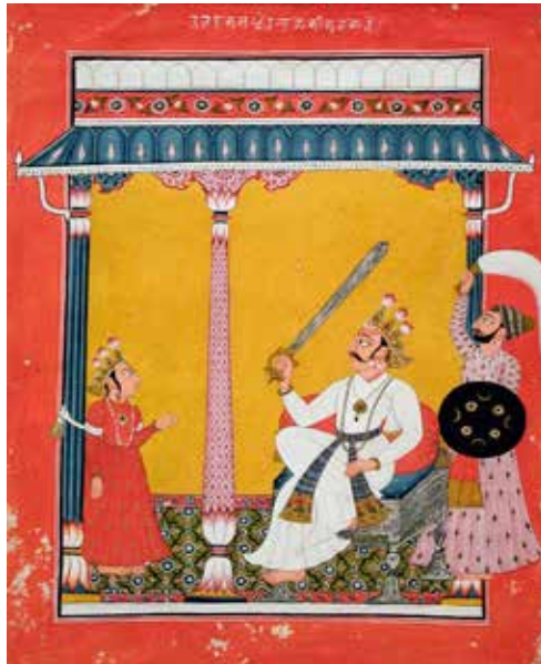
Hiranyakasipu sur le point de décapiter son fils Prahlada

Avec ces mots, il envoya le garçon une fois de plus vers son précepteur. Là, le garçon honora toujours le précepteur et apprit la sagesse de celui-ci.