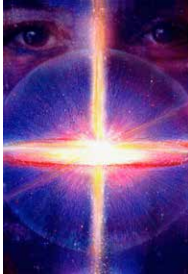
Image du Mois de la Balance Balance – De la Périphérie vers le Centre

Depuis votre périphérie, vous entrez dans la profondeur de votre être. Ce n'est pas encore la profondeur totale. Vous venez jusqu'à un point où les horizontales rencontrent les verticales. L'homme se tourne de l'objectivité à la subjectivité et se déplace dans la subjectivité. Alors, il rencontre la colonne verticale à l'intérieur. C'est exactement ce dont parle Patanjali comme d'une étape après le Pranayama. Lorsque votre respiration vous a retiré dans la pulsation, votre pulsation vous a retiré dans la pulsation subtile, alors le Prana est régularisé. Alors, vous rencontrez une colonne verticale. Ceci est établi comme « les horizontales rencontrent les verticales ».