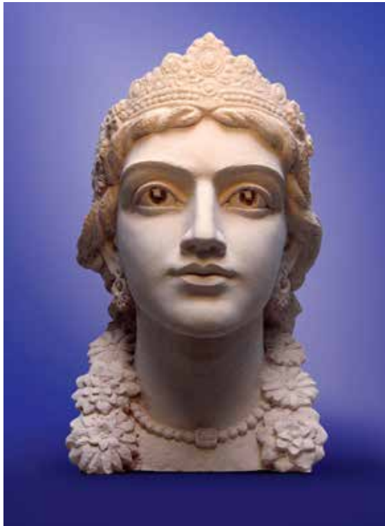
Krishna - Sculpture d'Alexey Leonov

eignants ne sont pas de simples conseillers. Ils travaillent aussi comme sculpteurs, charpentiers et comme mouleurs, une fois qu'ils acceptent quelqu'un comme étudiant. Arjuna a développé, par l'association avec Krishna, non seulement un grand goût envers Krishna, mais il a aussi trouvé en lui un sage qu'il peut suivre sans aucune hésitation.