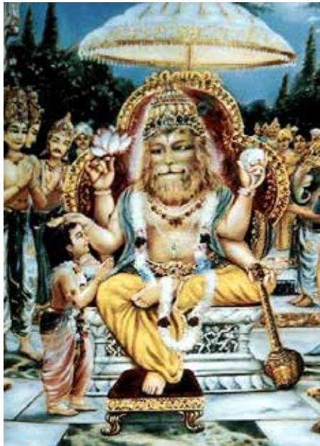
Le Seigneur bénit Pahlada

sur l'arrière-plan de Ton existence indistincte. Remplie de craintes et, au même moment, pleine de grâce, est Ta forme. Tu es notre sagesse et notre ignorance. Tu es la forme de l'existence et l'Etre en non existence. Tu conçois notre existence et notre non existence. Tu es le moment éternel et transitoire qui emplit l'éternel. Tu es la constitution des cinq états d'existence. Cependant, les cinq états n'existent pas pour Toi et Tu es pur. Tu es l'Unique avec les nombreuses parties en Toi. Je me prosterne devant le Suprême Purusha qui rayonne comme les êtres subtils, denses et manifestés de la création. Je me prosterne devant l'Un qui n'est pas du tout cette création et duquel cette création émerge. Je m'incline devant Lui dans Lequel tout ceci existe et dans Lequel tout ceci fusionne. »