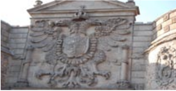
L'Aigle de Tolède