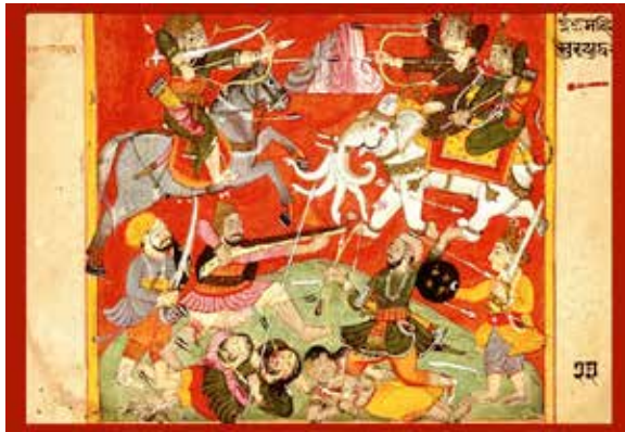
Combat des Dieux et des Démons

Le nombre de naissances de diaboliques est bien plus élevé que le nombre de naissance de divins parmi les hommes. Le paradoxe est que l'humanité recherche le royaume de Dieu, tandis qu'elle travaille de manière diabolique. L'humanité est dans un paradoxe. Elle rêve à propos d'un paradis !