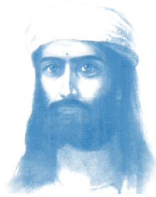
Maître Morya Maruvu Maharshi