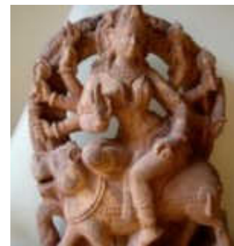
La déesse Durga sur un Tigre.

Vous savez tous que la sagesse totale est la relation entre le centre et la circonférence. Elle est appelée Pi. La relation du centre à la circonférence est Pi. C'est la racine qui conduit l'âme individuelle à l'âme universelle, et relie également, l'âme universelle à l'âme individuelle, c'est aussi le chemin. C'est pourquoi, la Balance forme l'être véritablement vertical de la création et aussi des êtres humains. - À continuer