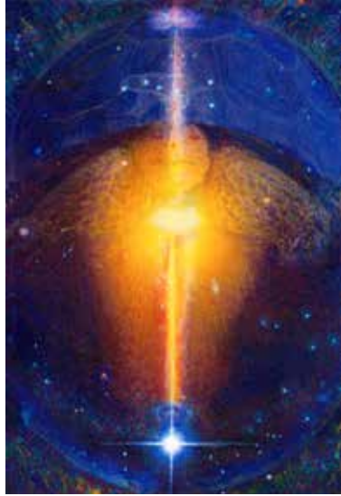
Image du Mois du Scorpion Le Scorpion – Le Cœur de la Tortue

Il y a un dôme supérieur des énergies présidé par le Pôle Nord. Dans ce dôme, la Grande Ourse des Sept Etoiles peut être vue. Le dôme supérieur est visualisé par les sages comme la carapace convexe de la tortue. Les énergies du pôle inférieur ressemblent à un dôme inversé ou à une assiette. Dans cette assiette est vu le mouvement de l'étoile du Sud appelée Sirius. La constellation de Sirius travaille comme un Chien, tandis que les sept étoiles se déplaçant autour du Pôle Nord travaillent comme une Grande Ourse. L'étoile du Sud est l'Etoile du Chien, tandis que les sept étoiles du Pôle Nord sont la Grande Ourse. Dans le corps humain, le Pôle Nord est au-dessus de la tête. Les Sept Etoiles de la Grande Ourse sont dans le dôme supérieur du crâne dans la région du Sahasrara. Le dôme du crâne est comme la grotte de l'Ourse. L'Ourse y réside. De même, L'Etoile du Chien au Pôle Sud peut être visualisée dans le corps humain, tout près de l'extrémité de la colonne