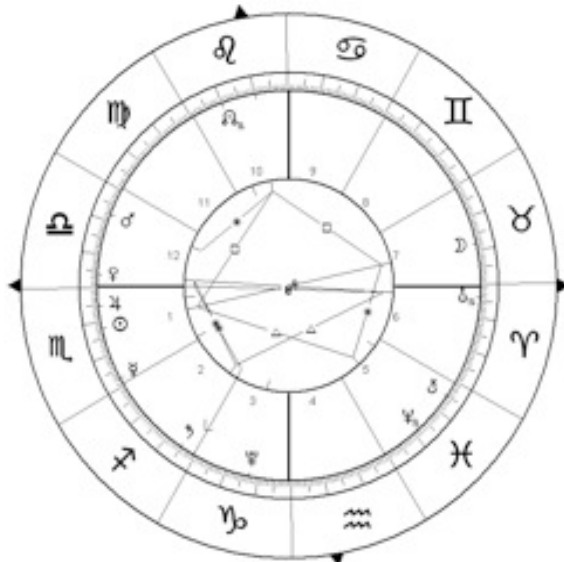
Pleine Lune du Scorpion, 4 novembre 2017, 06.23.

LE BONHEUR EST DANS LE FAIT DE DONNER ET NON DE PRENDRE. LE SOLEIL DONNE LA VIE. IL EST HOMME. LA LUNE REÇOIT. ELLE EST FEMME. LA LUNE A DES PHASES DE CROISSANCE ET DE DÉCROISSANCE.