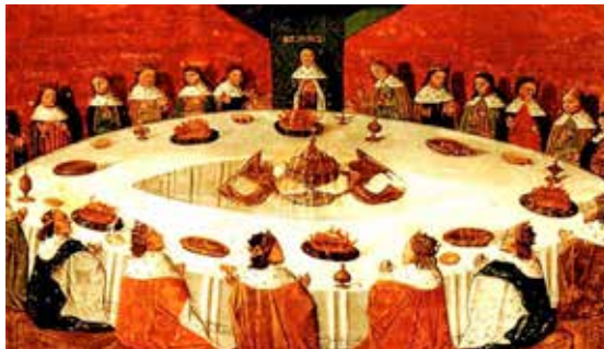
Les chevaliers du Roi Arthur, rassemblés autour de la Table Ronde, pour célébrer la Pentecôte, voient une vision du Saint Graal porté par 2 anges. Anonyme, 1470.

Un homme qui pense doit trouver son propre chemin dans la nature et la loi de la nature, en adoptant les valeurs qu'il trouve dans les différents systèmes de croyances, les traditions et les religions, et non en se soumettant aveuglément à aucune d'elles. Une telle approche est aidante.