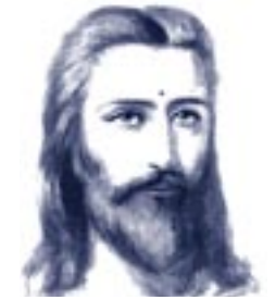
Maître Koot Hoomi - Devapi Maharshi -

Le Christ parle de ce Nirvana lorsqu'il dit : « Mon Père dans les cieux et moi ne sommes qu'un ».