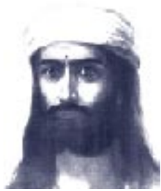
Maître Morya - Maruvu Maharshi -