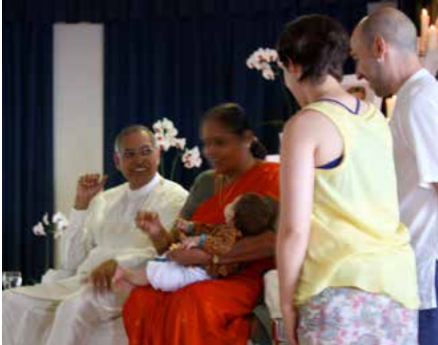
Bénédiction des enfants, Espagne, Juin 2013

ceux qui sont très actifs et très perspicaces. Cela ne doit pas être compris comme de l'hyperactivité. Ne laissez pas les parents se mettre dans la voie de l'épanouissement naturel des enfants.