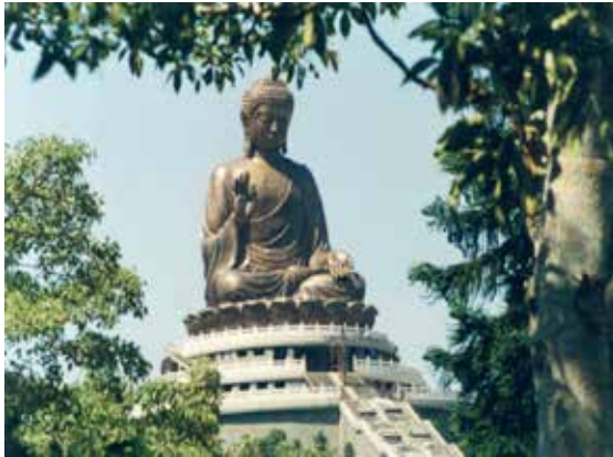
Une statue de Bouddha à Hong-Kong.

Ce n'est pas hors contexte que sur la planète il y ait un endroit où le parfum était utilisé traditionnellement avec abondance et la ville elle-même a été appelé parfum. Hong Kong signifie lieu de parfum. Aujourd'hui, Hong Kong est tout autre. Pourtant, il y a un monticule dédié à Bouddha où, aujourd'hui encore, le parfum est abondamment utilisé.