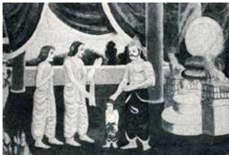
Prahlada enseignant face à Hiranyakasipu.