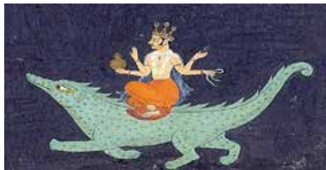
Varuna sur Makara

Ce texte n'est pas relu par l'auteur et peut contenir certaines erreurs.