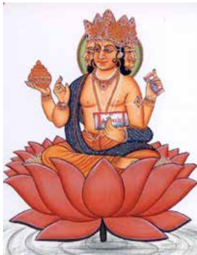
Brahma, le Créateur

Les prétendus démons sont les êtres égoïstes qui s'affirment de façon excessive et sont dès lors ignorants. Ils agissent comme un pôle tandis que l'activité de la Lumière forme un autre pôle. Ainsi, la Création tend à être bipolaire. Dans les Puranas aryens, les démons sont appelés 'asuras' ; ceux-ci sont les asuras auxquels Zoroastre se réfère en tant que les Ahuras.