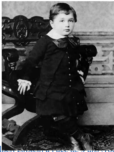
Albert Einstein à l'âge de 3 ans (1903)