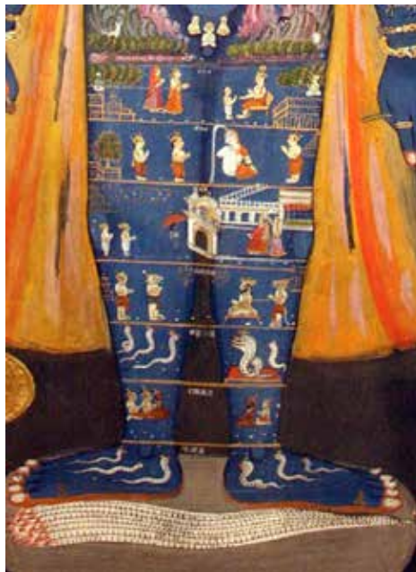
Les Mondes Inférieurs dans la Personne Cosmique

commence à s'expanser, alors la Terre entière tremble avec toutes les montagnes, les océans et les forêts. Ni les Gandharvas, ni les Apsaras, ni les Siddhas, ni les Kinneras, ni les Charanas, ni les serpents eux-mêmes, ne peuvent concevoir la fin des qualités de ce Grand Seigneur de l'Eternité. La pâte sacrée de bois de santal qui Lui est appliquée par les demoiselles serpents, atteint la fin de toutes les directions, étant soufflée par Ses expirations. Elle existe dans l'eau des océans. Le grand sage Garga le vénéra et put connaître la science des lumières célestes, la science de la prophétie et de la divination. Etant soutenue par les têtes de ce Seigneur des Serpents, cette Terre porte tous les plans de l'Existence comme les maillons de la guirlande d'un enfant. »