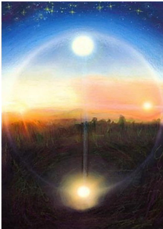
Imagem para o Mês Câncer - A Cruz Cardeal

A unidade de um dia solar, com seus quatro pontos cardeais, encerra todos os segredos da criação e seu condicionamento temporal como um espécime e símbolo autossuficiente. O nascer do sol é um verdadeiro símbolo do início de nossa criação numa escala; nosso nascimento individual, em outra escala e nosso despertar do sono todas as manhãs, em outra escala. O pôr do sol é o símbolo do fim e nosso sono é o símbolo de toda subjetividade que chamamos de Pralaya. O dia é um epítome do ano e o ano é um epítome de ciclos maiores através dos séculos e Yugas.