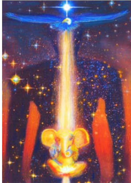
IMAGEM DO MÊS PARA O SIGNO DE SAGITÁRIO: SAGITÁRIO - - CONTEMPLAÇÕES SAGITARIANAS

A águia representa um pássaro que voa da terra até o sétimo céu. Seu caminho é de ascensão, portanto é considerado um caminho vertical. A águia simboliza a aspiração nobre que vai além da terra. Sagitário representa esse tipo de aspiração nobre. A primeira constelação de Sagitário chama-se Mula que literalmente significa esquina. Representa nosso chacra Muladhara (o centro básico). A constelação de Aquila (a águia) está a aproximadamente quatro graus de Sagitário, o que permite levantar voo.