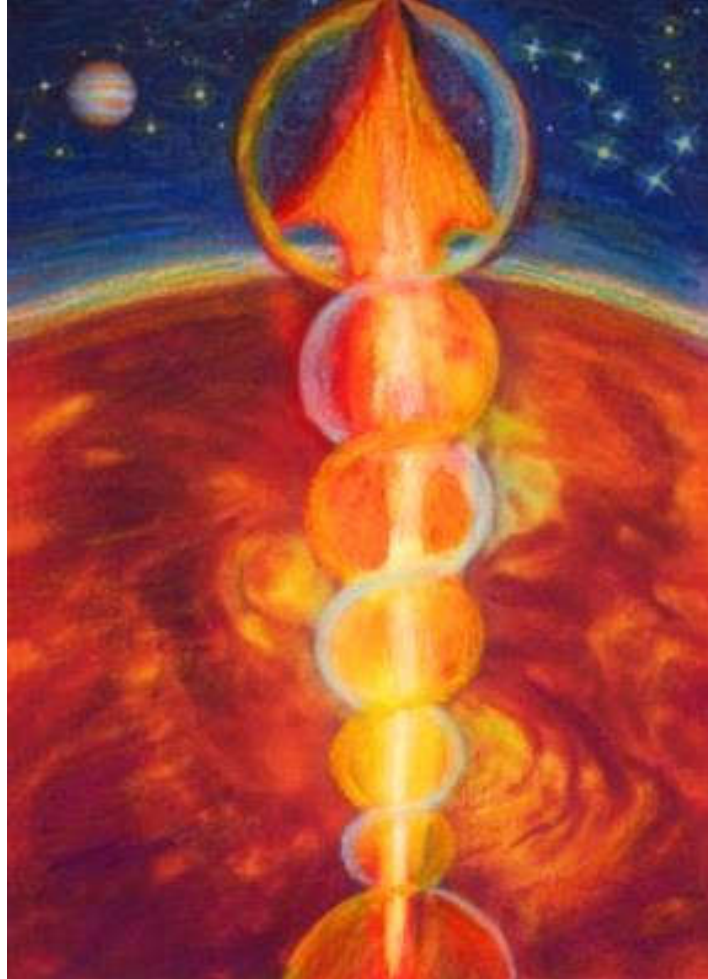
IMAGEM DO MÊS PARA O SIGNO DE SAGITÁRIO Sagitário - O Caminho do Retorno Através de Sushumna

Sagitário significa atirar alto. Objetivos nobres podem ser estabelecidos e alcançados com a energia de Sagitário. Limitações podem ser superadas para alcançar o estado de liberação através da vontade de Sagitário. Sagitário é o atirador. Sagitário também é o juiz; daí o atirador não falha. Sagitário representa o Caminho do Retorno através de Sushumna para alcançar a bem-aventurança de Peixes.